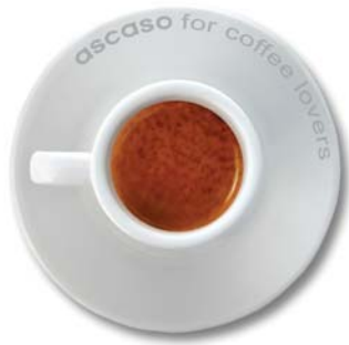
A perfect cup for coffee lovers La taza perfecta para los amantes del café.